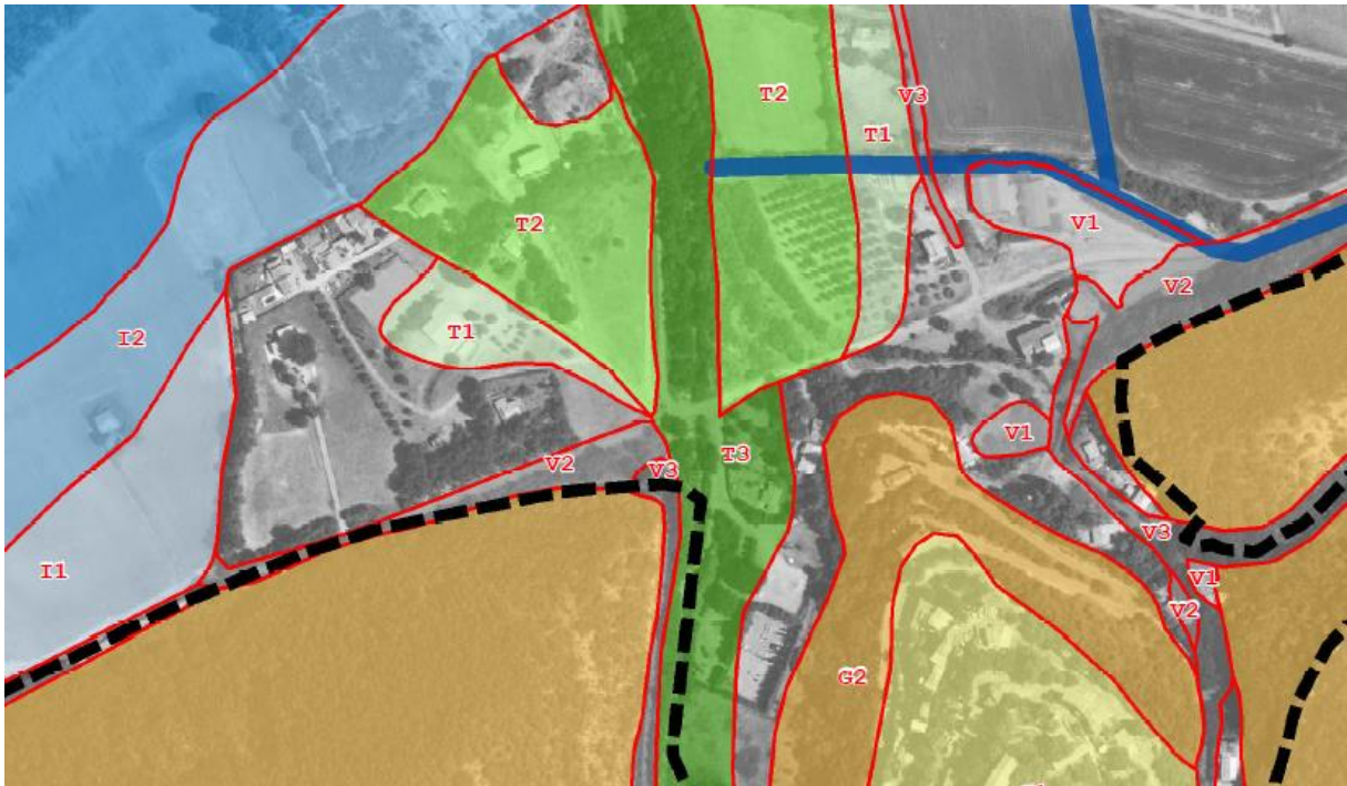
Extrait de la cartographie informative des phénomènes naturels multirisque sur la commune

En page 11 du règlement, il est indiqué : « Les prélèvements de matériaux dans les cours d'eau, aux fins d'entretien et de curage de leur lit, leur endiguement et d'une façon générale, les dispositifs de protection contre les risques naturels, peuvent être autorisés nonobstant les règles applicables à la zone ». Il pourrait être précisé « dans le respect de la réglementation applicable au titre du code de l'environnement ».